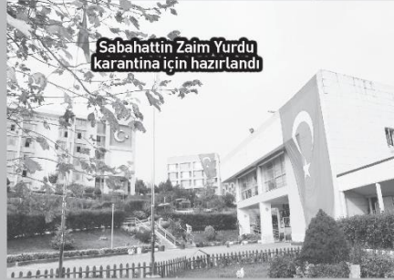
Sabahattin Zaim Yurdu karantina için hazırlandı

si konusunda gerekli hassasiyeti göstereceklerine inanıyorum. Yurtlarımıza takviye personel gönderdik. Temizlik ve dezenfekte malzemeleri konusunda sıkıntımız yok. Öğrencilerimizin mağdur olmaması için elimizden gelen tüm imkanlarımızı seferber ediyoruz" dedi. Sakarya Gençlik ve Spor İl Müdürlüğü, 14 gün boyunca gözetim altında kalacak öğrencilerin, kalacağı yurtlara dezenfekte çalışması yaptı. Çin'de