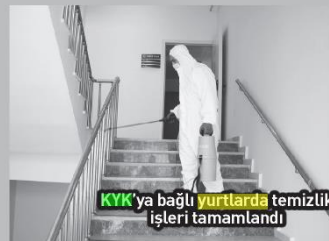
KYK'ya bağlı yurtlarda temizlik işleri tamamlandı

yurtlar ve tesisler periyodik olarak dezenfekte ediliyor.