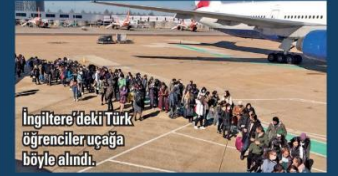
İngiltere'deki Türk öğrenciler uçağa böyle alındı.

YURTDIŞINDA Kİ Türk öğrencilerin yurda getirilmesi dün de devam etti. Öğrenciler çeşitli yurtda karantinaya alındı. KKTC'den dönüş yapan 395 Türk öğrenci ve Lübnan'dan gelen 44 TIR şoförü, ilk olarak feribotla Silifke ilçesi'ne bağlı Taşu-