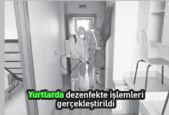
Yurtlarda dezenfekte işlemleri gerçekleştirildi

Çin'de başlayan ve bütün dünyayı saran korona virüsünün etkilerini en az indirmek için Sakarya Gençlik ve Spor İl Müdürlüğü, yurtlarda ve diğer tesislerde öğrencilerin elinin değdiği ve yoğun olarak kullandıkları, masalar, pencere kulp-ları, yemekhaneler, kantinler, koridorlar, tuvaletler başta olmak üzere tüm